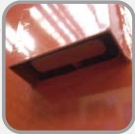
扉がロック式 金属レバーを押し上げる。