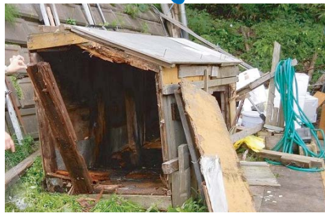
ヒグマによって破壊されたゴミステーション。 十分な強度がなければクマに壊されてしまいます。