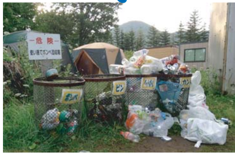
キャンプ地でのマナーの悪いゴミ出し。 ゴミの臭いが、ヒグマを誘因します。

弁当がらや残飯を含むゴミは、クマにとって魅力的な食べ物です。ゴミに一度餌付いたクマは、味をしめ、 何度もゴミを荒らす ようになります。そうしたクマの行動がエスカレートすると、やがて人家や物置に押し入ることもいとわないクマに変わります。ゴミに餌付いてしまったクマの行動を改善することは極めて困難です。人家や物置に押し入るようになったクマの最後は、“ 駆除 ”しかありません。 クマとのトラブルを回避するには、クマがゴミに餌付かないように、 ゴミ出しのマナーを守り、頑丈なゴミステーション や堅牢な建物内でゴミを保管することが大事です。