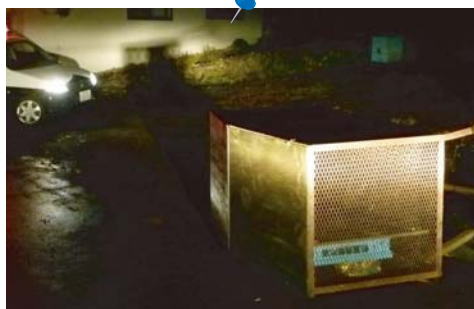
ヒグマによって引き倒された鉄製のゴミステーション 地面にしっかりと固定されていませんでした。